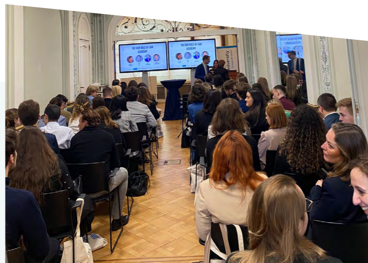
De deelnemers van de Our Rule of Law Academy Conferentie in Brussel op 16-17 maart

Op 16 en 17 maart 2023 vond in Brussel de Our Rule of Law Academy plaats, een project voor-studenten-door-studenten, mede georganiseerd door de Commissie Meijers. Het was een bootcamp voor 45 geselecteerde bachelor rechtenstudenten uit 25 lidstaten over de vraag "hoe bescherm je zelf de rechtsstaat in de EU?". In de weken voorafgaand aan de bootcamp in Brussel woonden de deelnemers online colleges bij en werkten ze met inspirerende mentoren in kleine groepen aan belangrijke rechtsstatelijke onderwerpen met als doel concrete beleidsinstructies op te stellen. In Brussel kregen de studenten de kans om hun voorstellen te