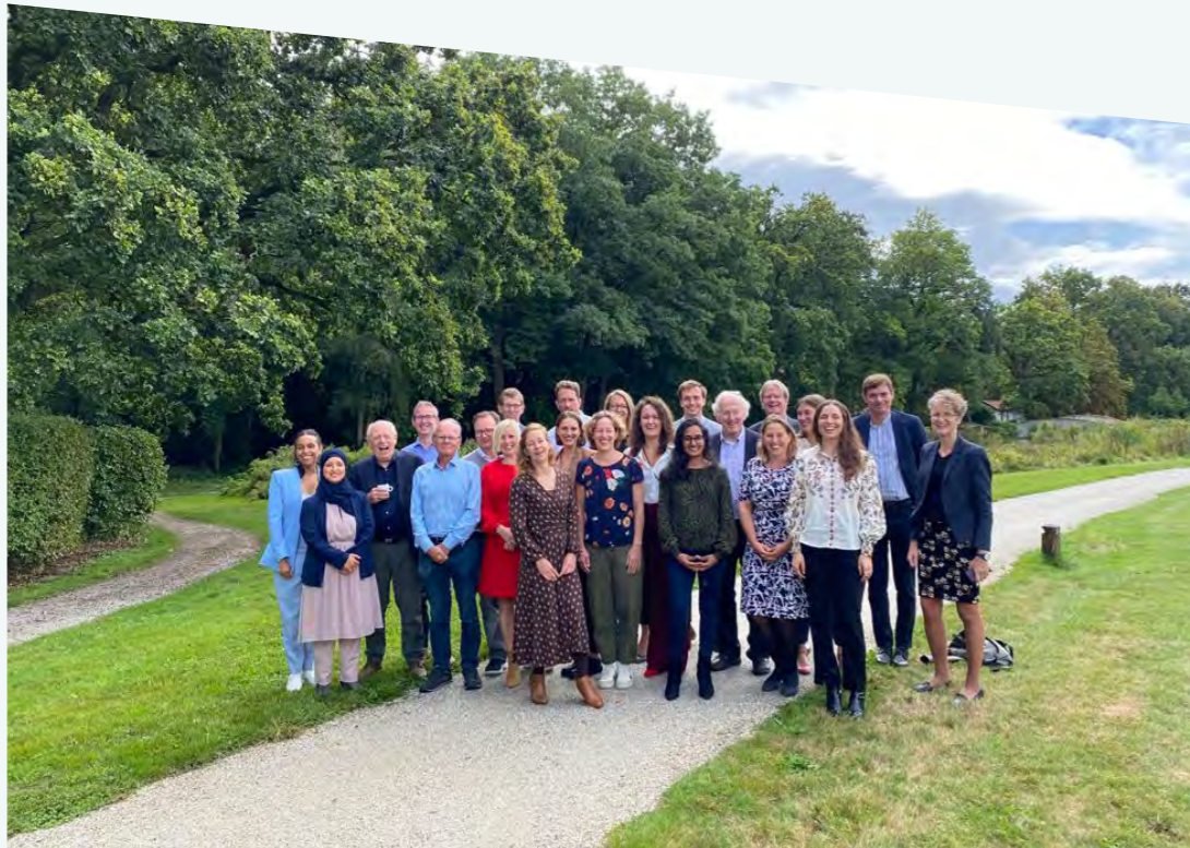
Leden van de Commissie Meijers

Onze subcommissies voor asielrecht, migratierecht, strafrecht, privacy en non-discriminatierecht en institutioneel recht hebben evenmin stilgezeten in het afgelopen jaar. Leden van deze subcommissies werkten mee aan de bovengenoemde commentaren en hadden gesprekken met belangrijke spelers in het veld, waaronder leden van de Tweede Kamer, medewerkers van de Ministeries van Buitenlandse en Binnenlandse Zaken en Koninkrijksrelaties en verschillende Europarlementariërs. Op nationaal niveau nam de Commissie Meijers deel aan diverse deskundigenbijeenkomsten in zowel de Eerste als Tweede Kamer. Gedetailleerde informatie over al deze activiteiten is te vinden in het vervolg van dit jaarverslag.