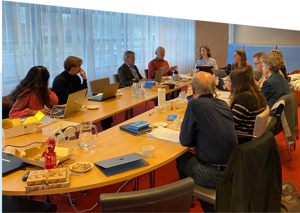
De leden tijdens een plenaire vergadering bij het College voor de Rechten van de Mens

Om de contacten van de Commissie relevant en actueel te houden, onderhouden de secretaris, de projectmedewerker en de Commissieleden een netwerk in Brussel en in Nederland.